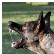
Negeen von Kaisersbari ♀ 14.10.2017 LOF 720798