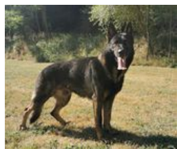
Rasko van de Biezen... ♂ 02.12.2018 LOSH 1189641 BH/VT, IGP 3